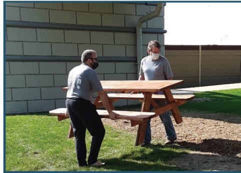
Placemaking en Crawford-Marlborough-Nakoma 2020