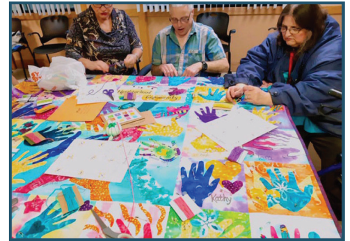
Edredón de la comunidad del Triángulo 2019

¡Puntos extra! Por agregar iniciativas para la recuperación después del COVID-19 a su proyecto de mejora de la comunidad o de liderazgo y desarrollo de capacidades del barrio. Más información en la página 2.