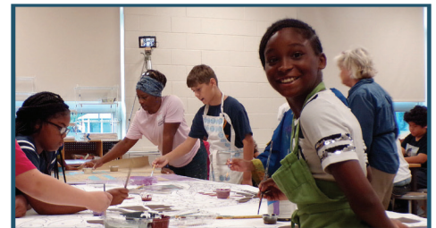
Mural del túnel Hawthorne/Truax E. Washington, 2019