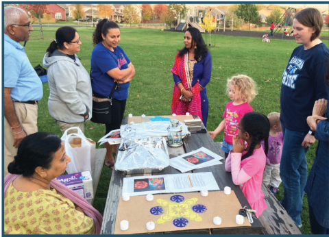
Celebración Secret Places Diwali 2017

Solicitud y directrices en línea: https://www.cityofmadison.com/dpced/planning/grants/1576/