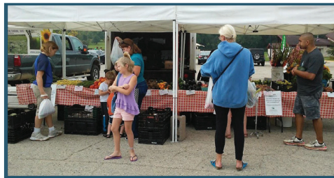
Aumento de la asequibilidad de Madison West Farmers Market en Elver Park, 2018