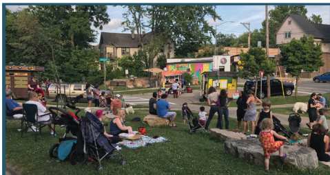
Jackson Plaza, 2017, punto de reunión en Schenk-Atwood-Starkweather-Yahara