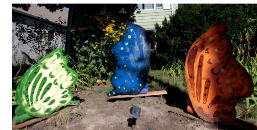
Sherman Yard Art 2015