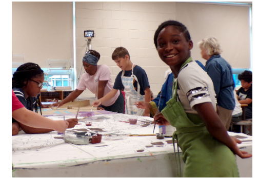
Mural del túnel Hawthorne/Truax E. Washington 2019