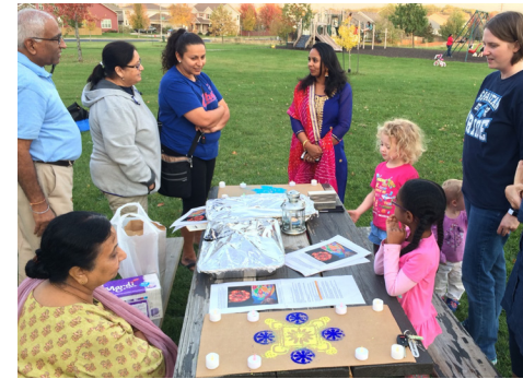
Celebración Secret Places Dawla 2017