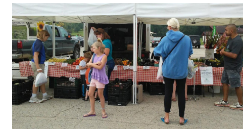
Aumentar la asequibilidad del Mercado de agricultores de Madison en Elver Park 2018