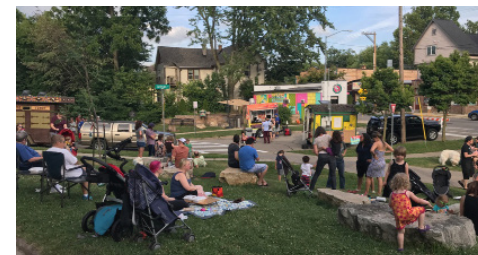
Lugar de reunión Schenk-Atwood-Starkweather-Yahara Jackson Plaza 2017

El Programa de subsidio a vecinos de la División de Planificación de la Ciudad de Madison ayuda a las zonas residenciales a embellecer las áreas de entrada, crear lugares públicos para reuniones o desarrollar la capacidad organizativa y las competencias de liderazgo. El programa de subsidio da el financiamiento, pero son las ideas, la determinación y el orgullo de los barrios los que están detrás de los proyectos más exitosos. En el 2020, la ciudad espera adjudicar alrededor en subsidios de $25,000.