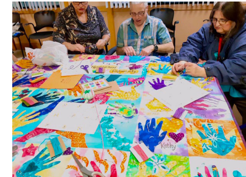
Colcha de Triangle Community 2019